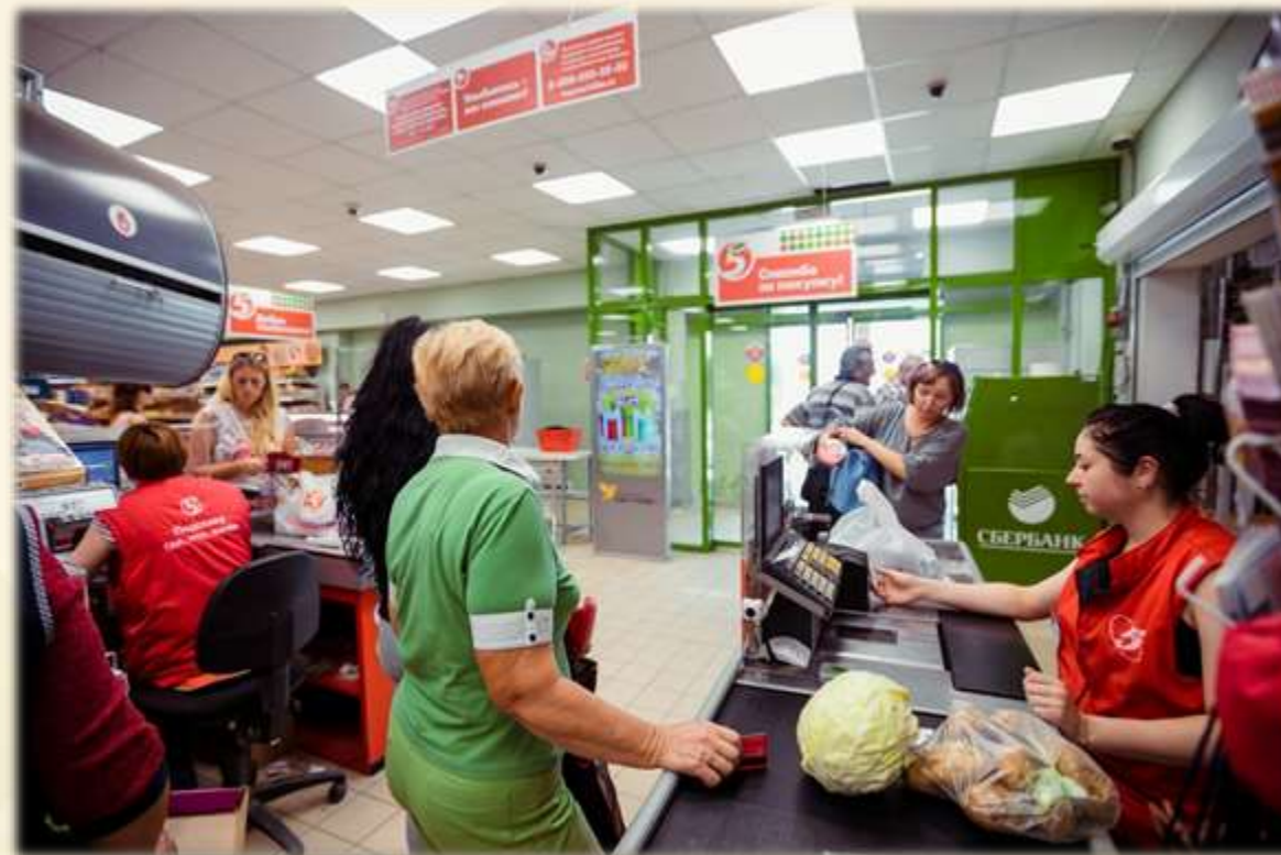
График работы 17 часов – 7 дней в неделю.

Вашу рекламу не переключают, не проходят мимо